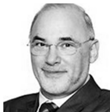
Léo Apotheker Vice Chairman of the Board of Directors, Independent Lead Director & Chair Governance and Remuneration Committee